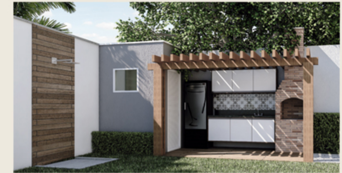
Deck com churrasqueira